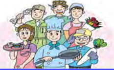
仲間の団結で営業を守ろう