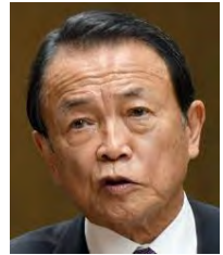
「政治に関心 持たず生きて いける国は良 い国です」と、 自民・麻生太郎氏の本音

「政治に関心がないのはけしからん」とえらそうに言う人もいる。しかし政治に関心を持たなくても生きていけるといえるのは良い国です。考えなきや生きていけない国のほうがよほど問題なんだ。(三重県桑名市内での講演で)(朝日新聞報道)