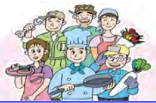
仲間の団結で営業を守ろう