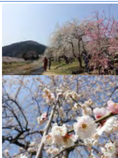
(入園料は無料・駐車場代500円)