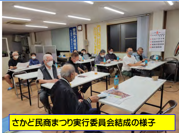
さかど民商まつり実行委員会結成の様子