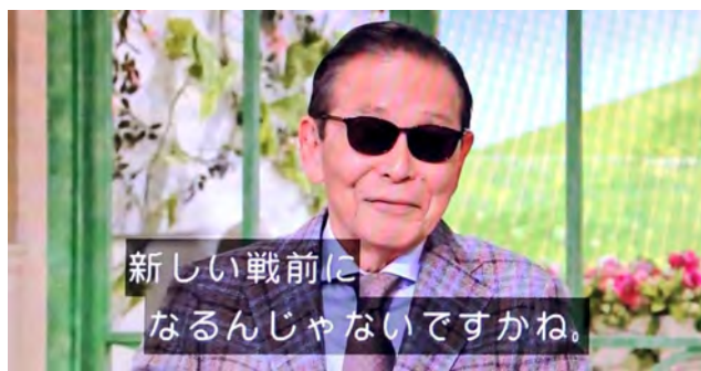
新しい戦前に なるんじゃないですかね。 タレントのタモリさんの言葉は現実味を帯びてきた(2023年を言葉で表すとの問いに)

1/17(火)・18日(水)は源泉税の納付書渡し 償却資産・法定調書等の印鑑押し1月26日(木)・1月27日(金)